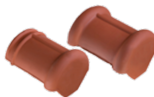
Halfronde beginvorst en eindvorst