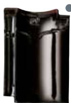
gitzwart glanzend verglaasd

● BLAUWE SCHERF ● DONKERE SCHERF ● RODE SCHERF