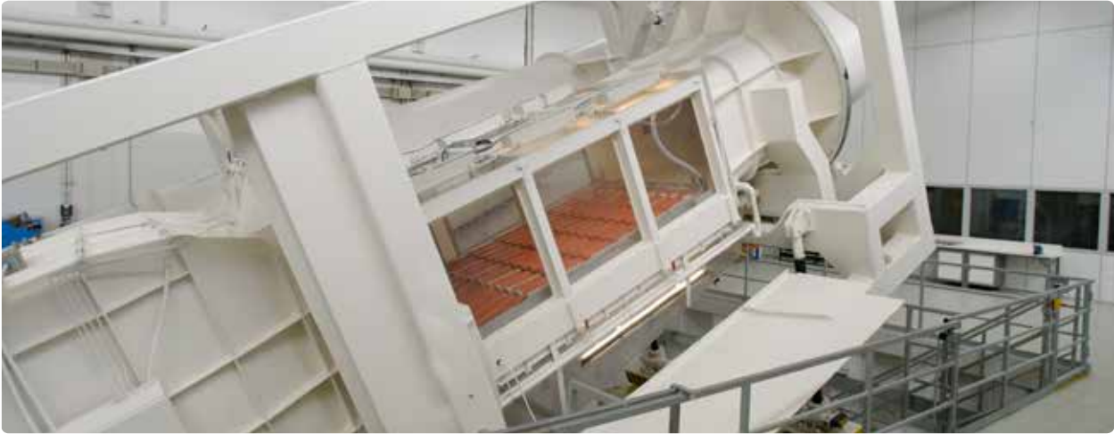
Bij Monier testen we onze dakpannen uitgebreid, onder andere in de wind- en regentunnel.