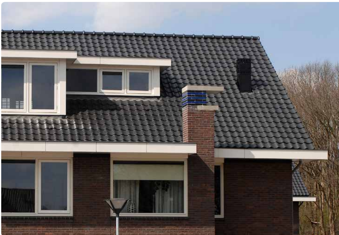
Zwart glazura edelengobe