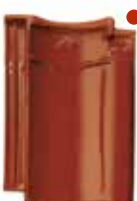
lichtbruin glanzend verglaasd