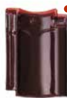
paars glanzend verglaasd