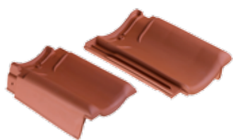
Gevelpan links en rechts