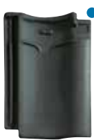
blauw gesmoord* naturel