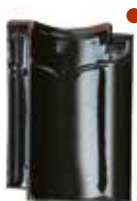
zwart glanzend verglaasd