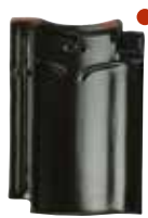
zwart mat verglaasd