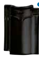
zwart glazura edelengobe