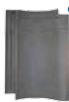
kwarts-grijs klassiek* gesmoord naturel