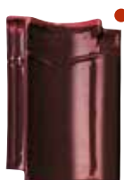
wijnrood glanzend verglaasd