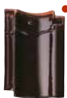
extra donkerbruin glanzend verglaasd